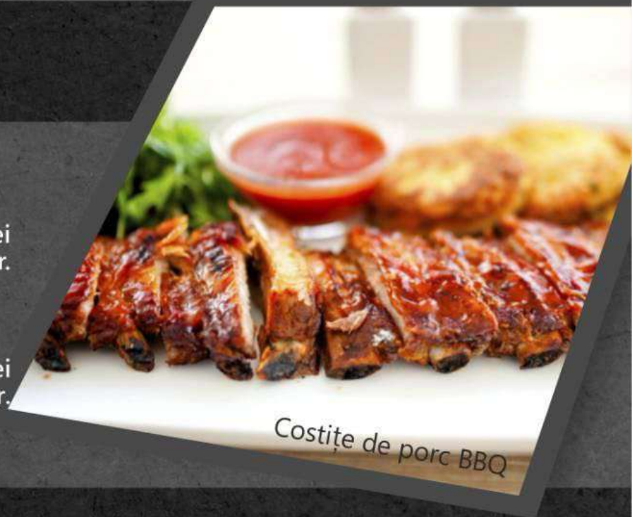
Costite de porc BBQ

*Aripi de pui Teriaki 85 lei *Крылья Терияки 200 gr. 200 lei