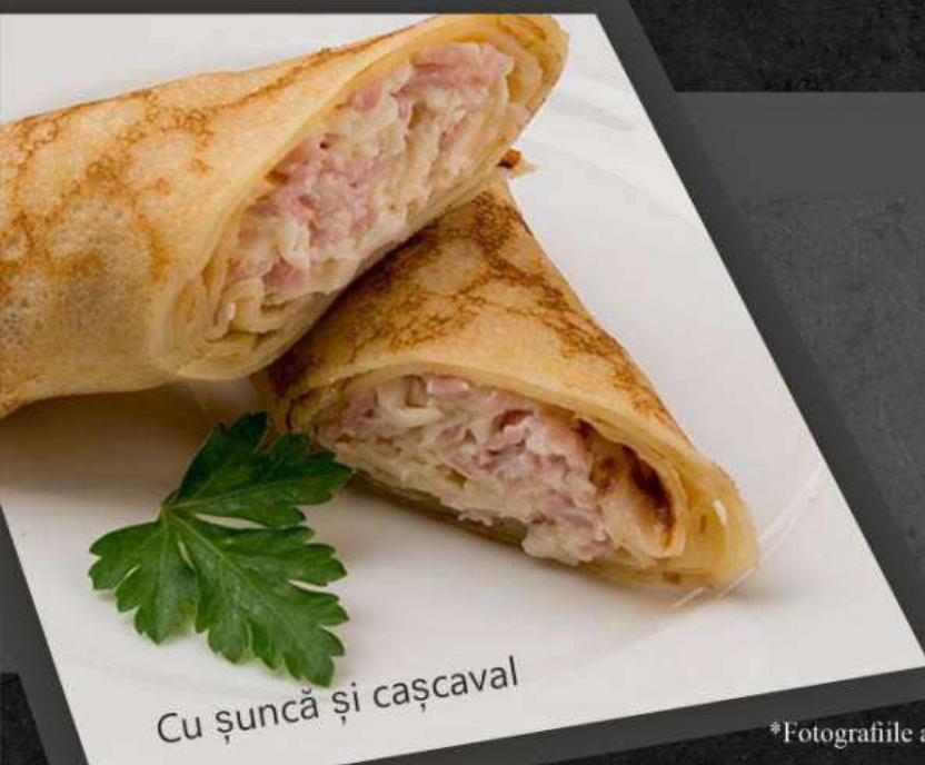
Cu șuncă și cașcaval