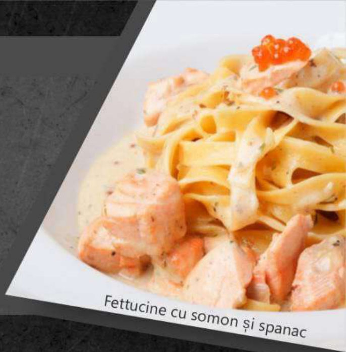
Fettucine cu somon și spanac

*Fettucine cu somon și spanac 130 lei *Феттучини с семгой и шпинатом 300 gr.