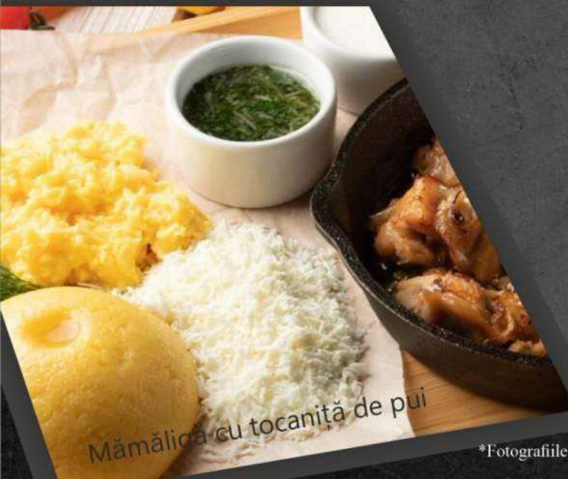
Mămăliga cu tocaniță de pui

*Mămăligă cu tocaniță de pui 120 lei *Мамалыга с куриным филе 400 gr. 400 lei