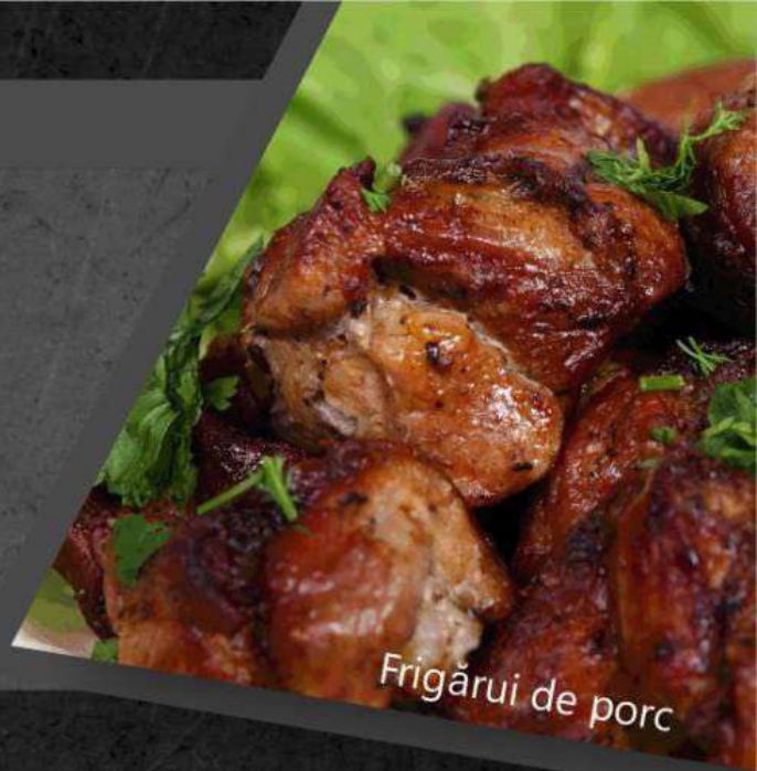
Frigărui de porc

*Frigărui de pui 150 lei *Шашлык куриный 200 gr.