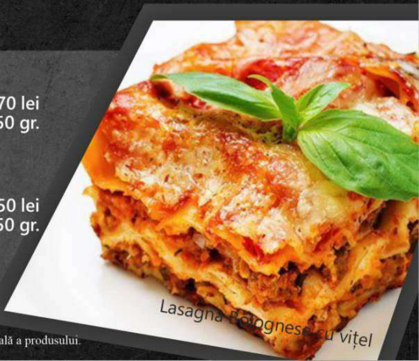
Lasagna Bolognese cu vițel

*Lasagna con pollo (cu pui) 150 lei *Лазанья с курицей 350 gr.